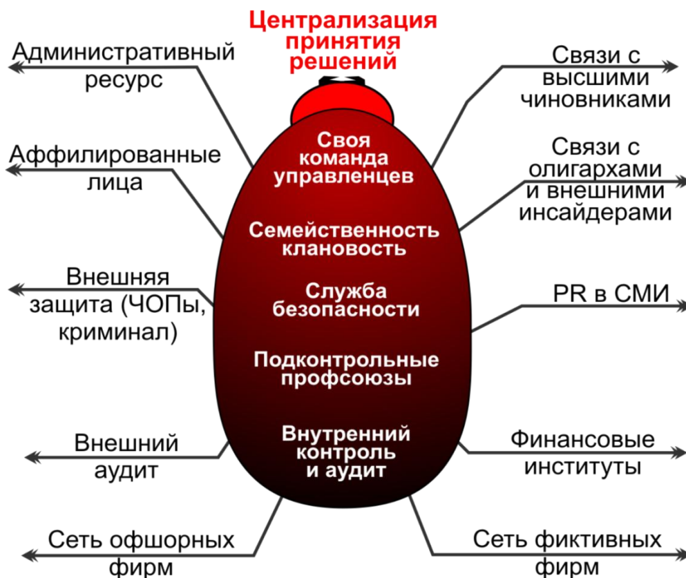
Рис. 3. Инфраструктура инсайдерского контроля (ИИК) в госкорпорациях

Однако выявлены и дополнительные внутренние и внешние элементы ИИК: 1) «своя» команда управленцев, 2) семейственность, 3) связи с олигархами, 4) административный ресурс, 5) цепочки трансфертных фирм (не только офшорных, но и фиктивных фирм), 6) PR в СМИ и др. (см. рис. 3).