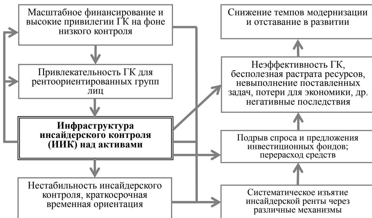
Рис. 1. Причинно-следственные связи в модели инсайдерского контроля в госкорпорациях

В данном исследовании доказывается, что многие государственные корпорации оказались в значительной степени подвержены негативному воздействию инсайдерского контроля и изъятия ренты, и именно это стало решающим фактором их неэффективности. Этот главный тезис включает несколько взаимосвязанных гипотез (блоков), подлежащих тестированию (см. рис.1).